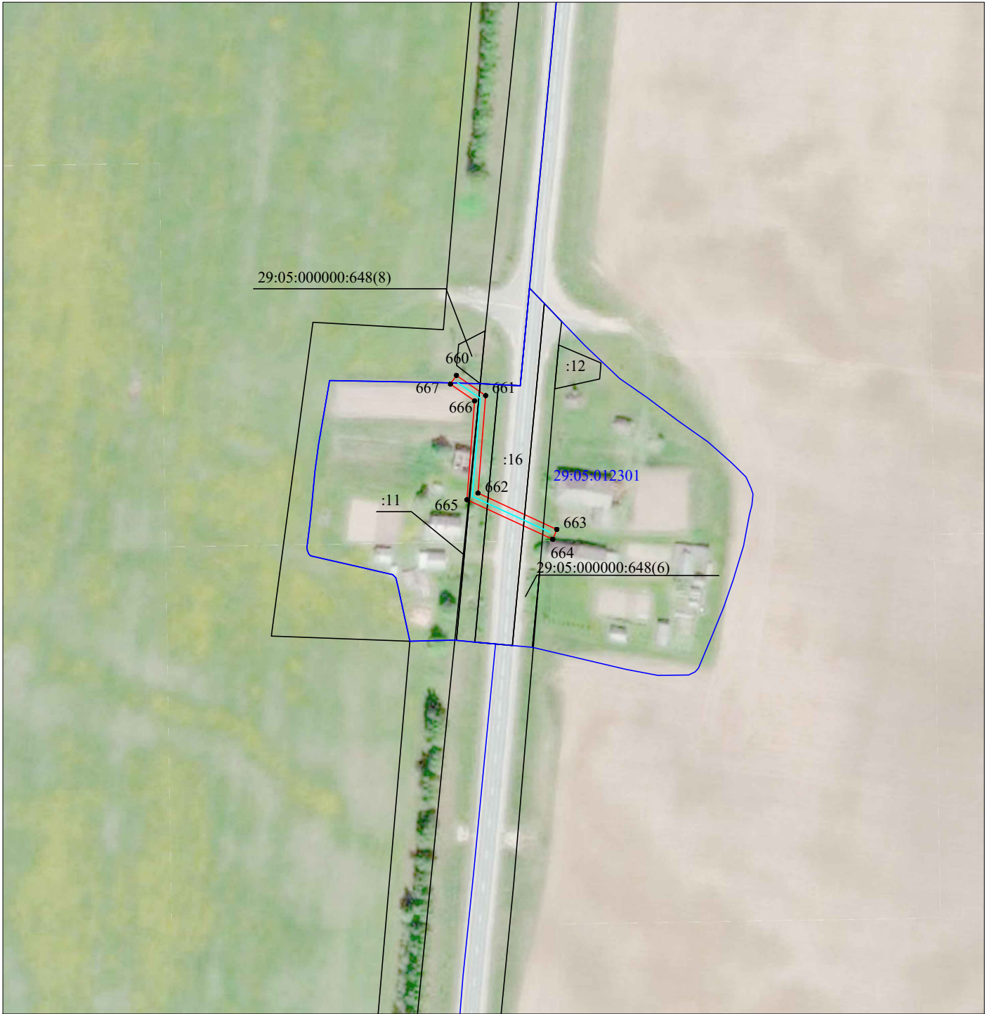
Масштаб 1:2 000